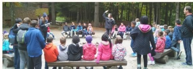
LE CAMP DES DEBROUILLARDS 2018