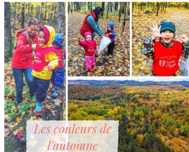
Les couleurs de l'automne