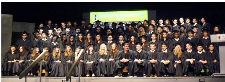
(Les finissants 2014)

100% de nos finissants poursuivent des études supérieures!